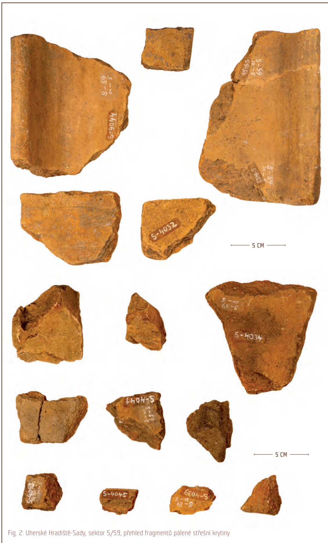
Fig. 2: Uherské Hradiště-Sady, sektor 5/59, přehled fragmentů pálené střešní krytiny