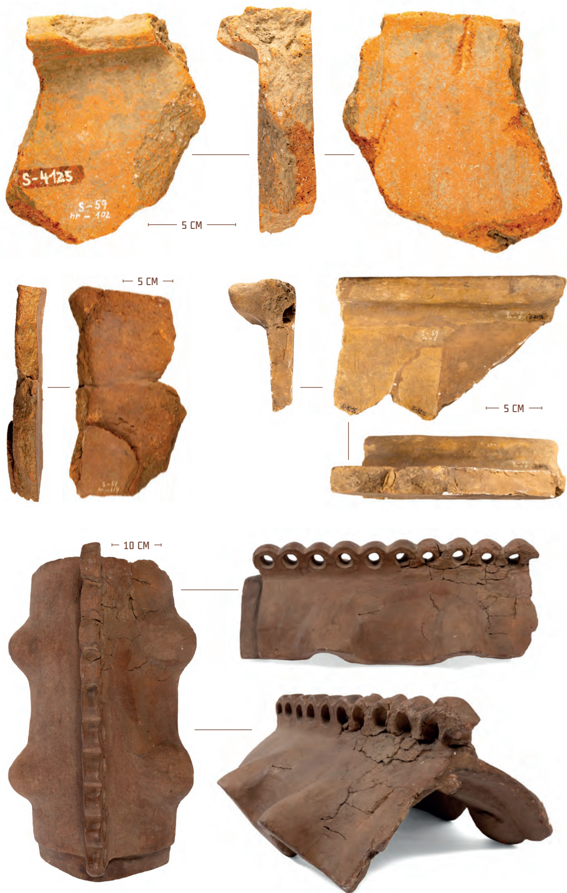
Obr. 29: Uherské Hradiště-Sady. Fragменты паленé стřešní krytiny 1. typu, tegule i. č. S 8213-8215 a i. č. S 4125 a ozdobná hřebenovka - celý, doplněný kus.