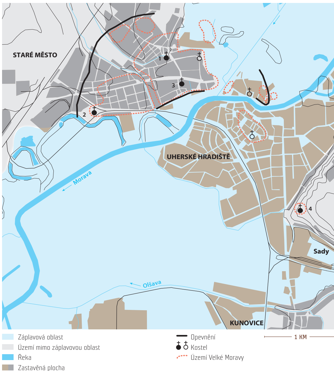
Obr. 1: Velkomoravská aglomerace Staré Město-Uherské Hradiště v 9. století s vyznačením církevních center 1: Na Valách, 2: Na Špitálkách, 3: Na Dědině u sv. Michala, 4: na Výšině sv. Metoděje v Uherském Hradišti-Sadech [podle Poláček et al. 2020, Fig. 46, doplněno L. Galuškou]

Ovšem ani tato vyhodnocení nálezů ze sídelních kontextů nebyla vyčerpávající. Stále do nich nebyly zahrnuty nálezy z mladší až pozdní doby hradištní a nedošlo ani na vyhodnocení nálezů běžné kuchyňské užitkové keramiky, resp. jejích částí, nalezených ve výplních objektů a v sídlištních vrstvách, případně ve výmětech z chat, které tvořily chodníky srubového sídliště severně od kostela. Vyobrazeny byly toliko kresby několika horních partií středohradištních hrnců z chaty II (Galuška 1996, Obr. 72). Nedostalo se ani na podrobné představení všech bezmála tisíce kusů pálené střešní krytiny antického charakteru, staviva důležitého pro pochopení významu celého sakrálního areálu, pocházejícího jak ze zánikových destruktivních vrstev kostela a kaple, tak i ze sídlištních a hrobových nálezových kontextů. To ze strany některých odborníků vedlo dokonce až ke zpochybnění závěru, že tato krytina byla na sadské výšině v době raného středověku použita ve své primární funkci, tedy, že se uplatnila na střeše přinejmenším některé ze sadských sakrálních zděných staveb. Také toto jsou důvody, které nás nyní vedou k nápravě zmíněných „nedodělků“.