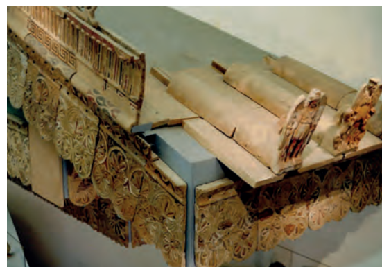
Obr. 12: Itálie, Řím, muzeum Etrusků ve Villa Giulia. Část rekonstrukce střechy etruského chrámu.