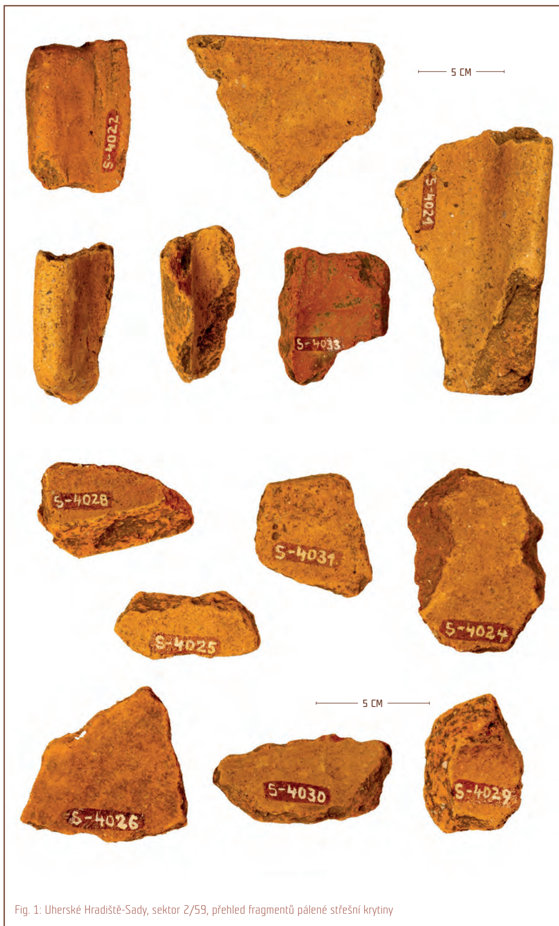
Fig. 1: Uherské Hradiště-Sady, sektor 2/59, přehled fragmentů pálené střešní krytiny