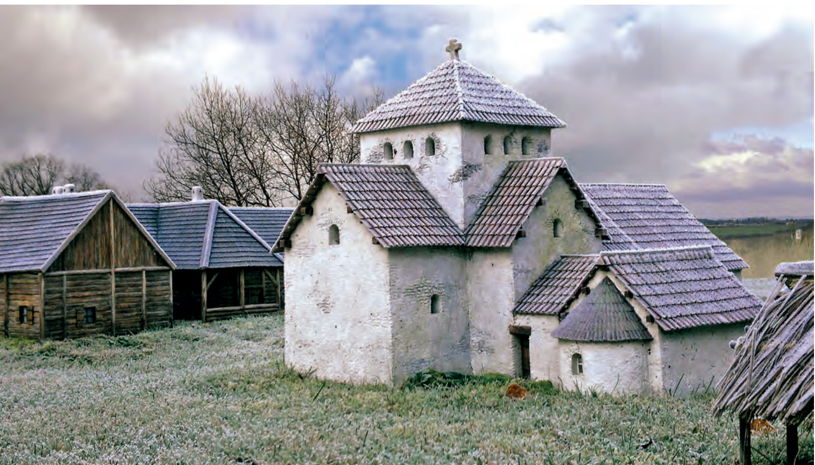
Obr. 54: Uherské Hradiště-Sady. Trojrozměrná rekonstrukce části velkomoravského církevního centra s kostelem a hrobovou kaplí, v pozadí s dlouhým dřevěným domem (Galuška 2017, 240)