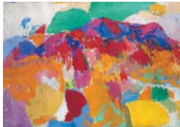
Ranská hora, 1959, olej / juta, 70 × 100 cm, Galerie Zlatá husa, Praha

Podobné řešení najdeme také u Victora Vasarelyho. Mluví o něm i sám Sýkora v rozhovoru s Josefem Hlaváčkem: „ Druhým typem jsou plochy rozdělené pravidelným čtvercovým nebo kruhovým rastrem, kde druhotná vkomponovaná soustava