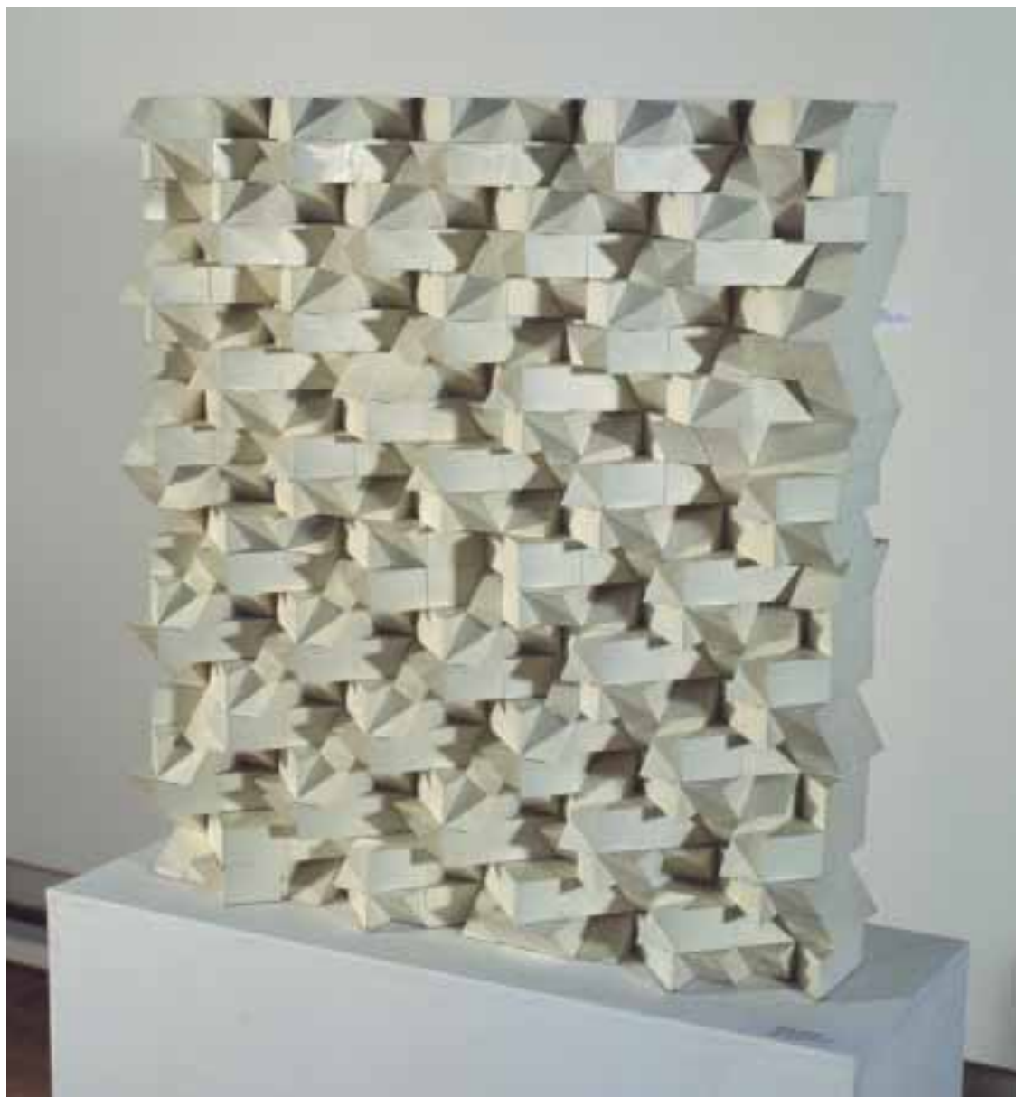
Struktura pravidelná, 1967, barva / dřevo, 79 × 72 × 20 cm, Národní galerie v Praze