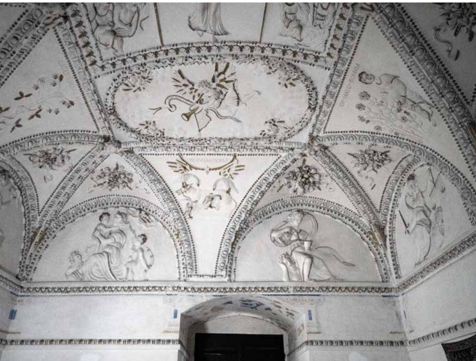
▲ Soudnice, západní partie klenby s lunetovými výsečemi. [JW]