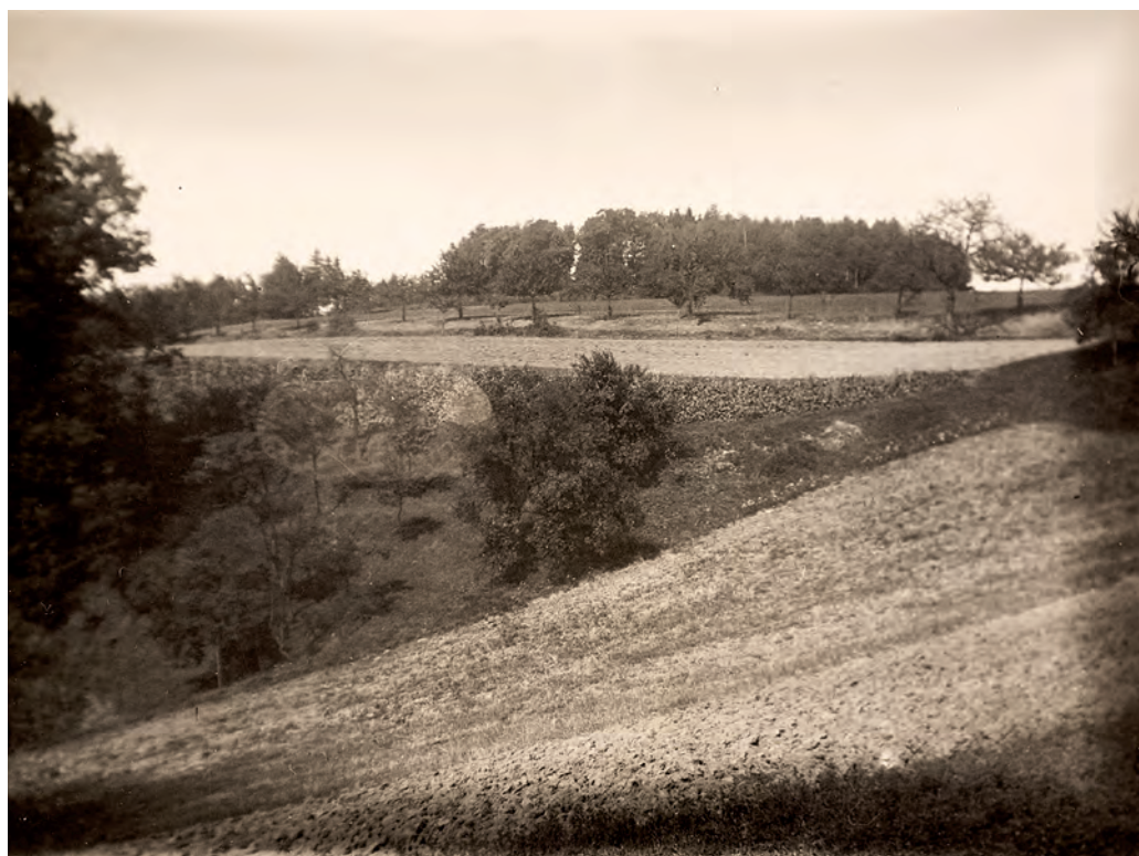
Pustý vrch u Lobče, pohled od jihovýchodu; Štorchova vilka je skryta v nízkém lesíku na levé straně fotografie (1947)

Pustý vrch [Desolate Hill] near Lobeč, view from the southeast; Štorch's villa is hidden in a small grove on the left side of the photograph (1947)