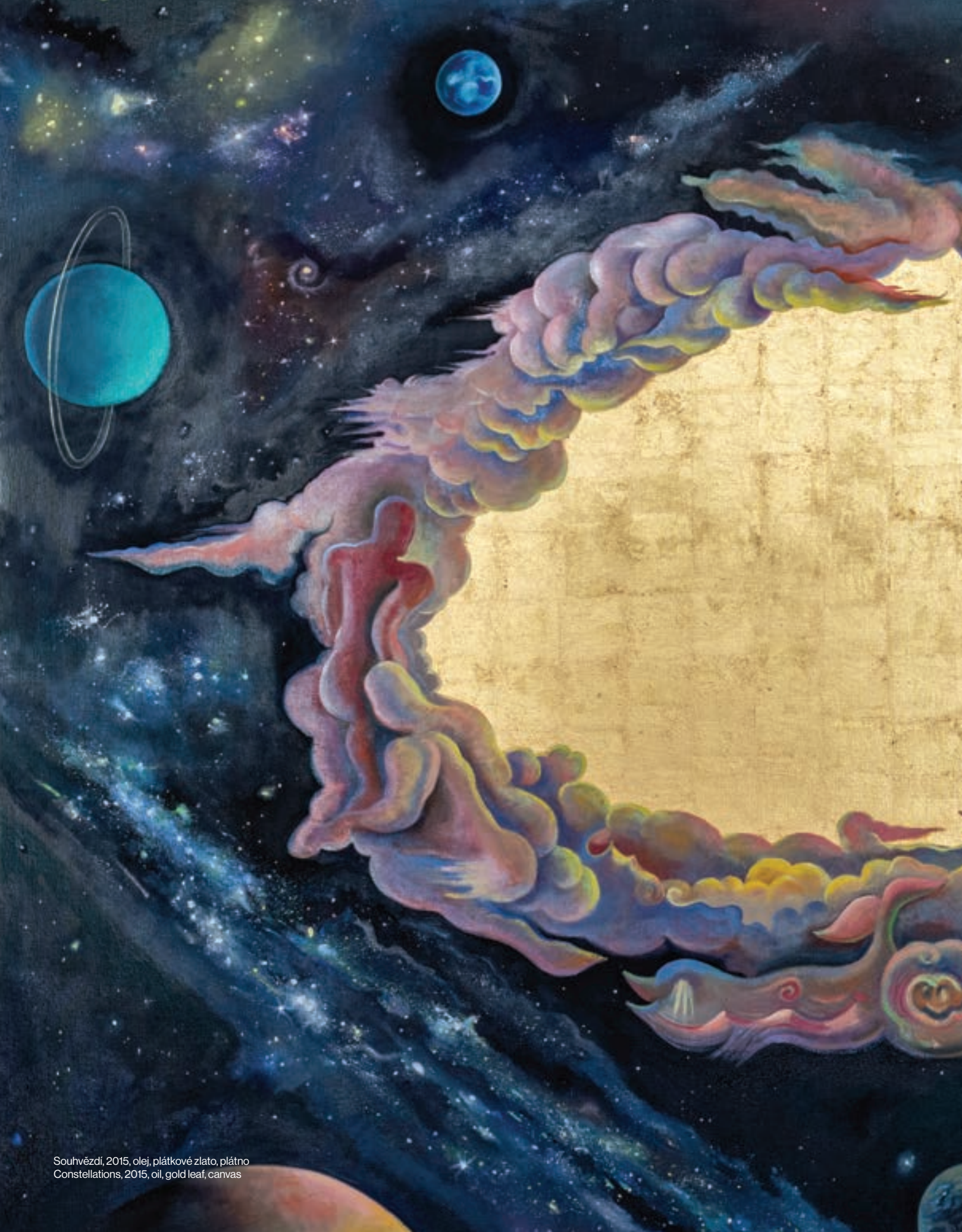
Souhvězdí, 2015, olej, plátkové zlato, plátno Constellations, 2015, oil, gold leaf, canvas