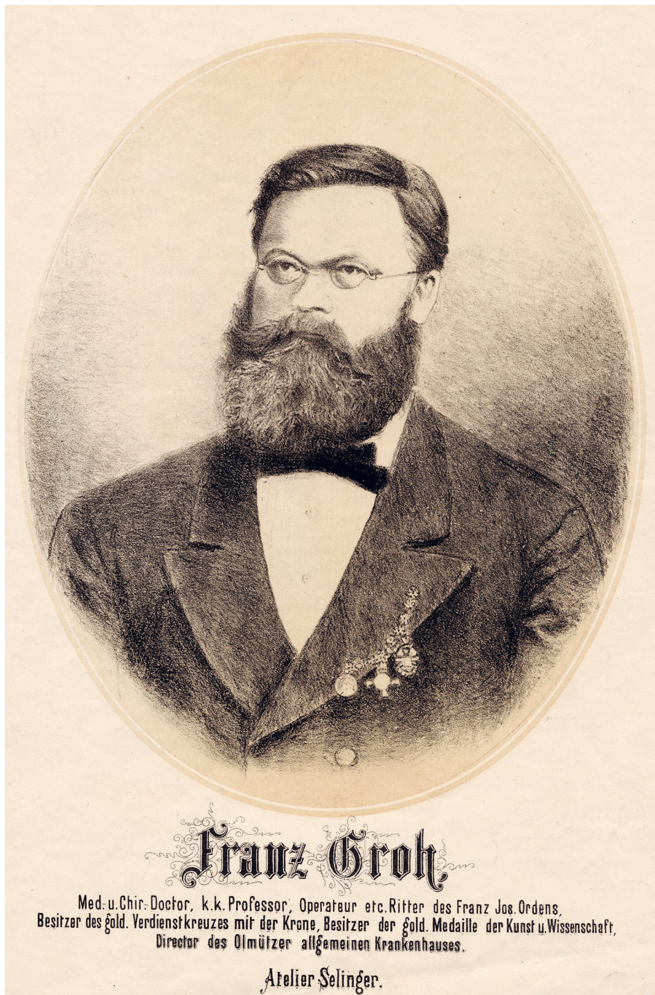
2 ▲ Franz Groh, autor Chronik der Franzens-Universität in Olmütz z roku 1878. Státní okresní archiv Olomouc, Sběrka litografií a fotografií, 507_M8-34_inv0037_sgl-042_SOKAOI.