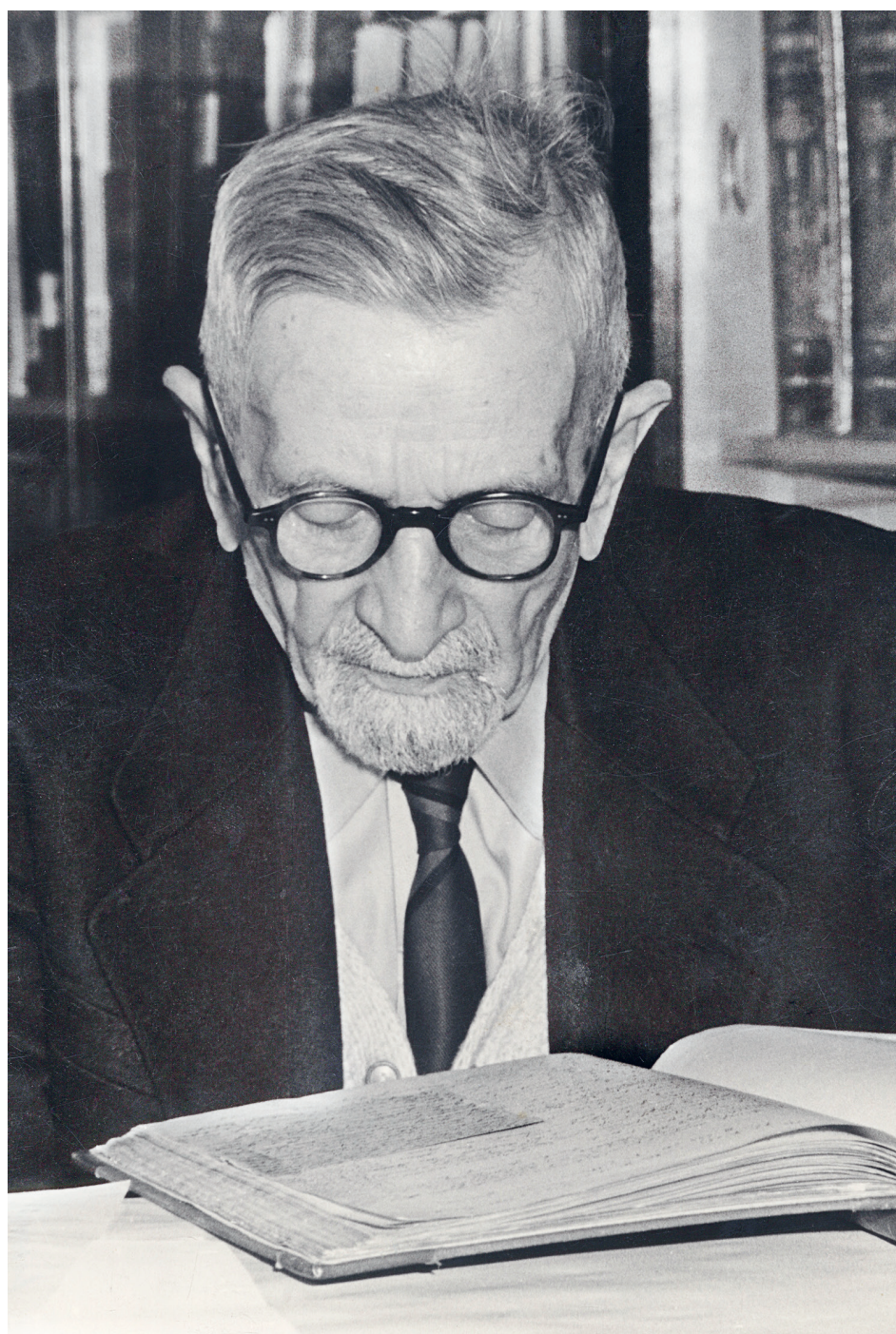
3 ▶ Václav Nešpor (1883–1973).

Základním zdrojem informací pro dějiny lycea a Františkovy univerzity je fond Univerzita Olomouc , jenž se v současnosti nachází v olomoucké pobočce Zemského archivu v Opavě. 7 Těžiště tohoto fondu představují dokumenty úřední provenience, resp. úřední knihy a akta, které byly původně součástí spisoven rektorátu, studijní komise či jednotlivých fakult. Jedná se tedy hlavně o spisový materiál spojený s administrativním chodem vysokého učení, písemnosti o přednášejících a rigorózních řízeních, studijní agendu, statistické přehledy a různorodé, zejména personální soupisy.